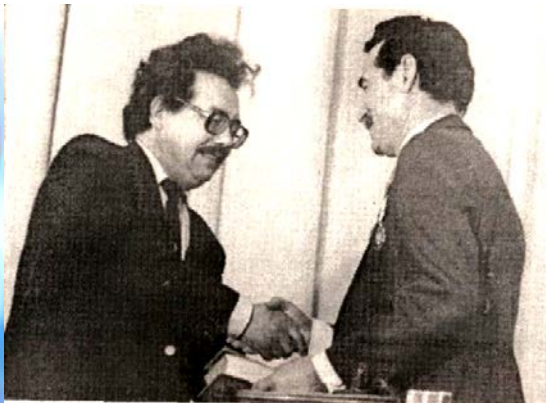
Татар драматург Т.Миңнуллин (шолаште) да М.Рыбаков.